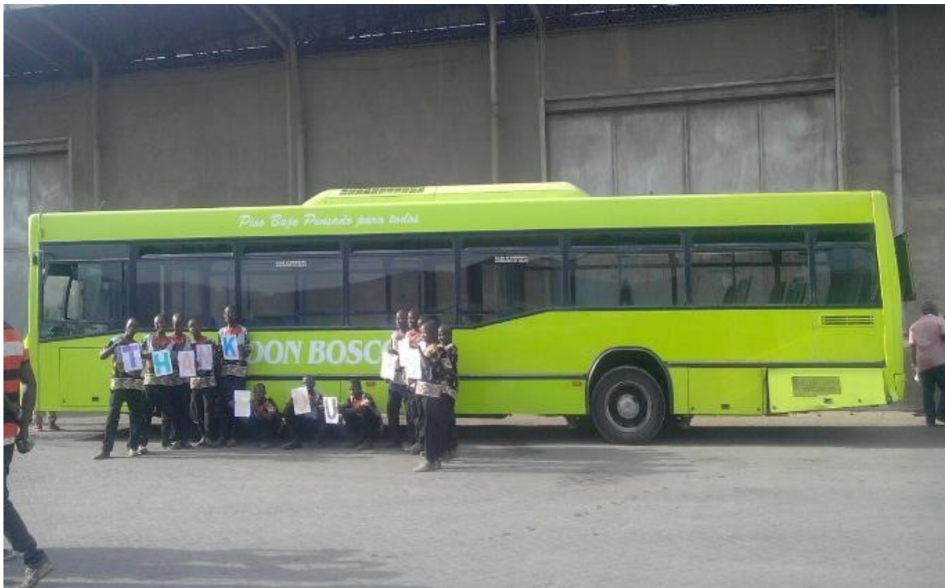
Los chicos residentes dan la bienvenida al Nuevo Autobús en el Puerto Queen Elizabeth en Cline Town. Abajo a la izquierda: fotografía de los donantes