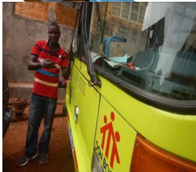
Conductor: Patteh preparado para rodar por las calles de Freetown.