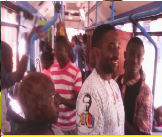
Interior del autobús: Esperando dar una vuelta