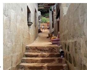
Angola Town : reconstruir sobre base sólida

Con el apoyo de la fundación Rodríguez Losada, techaremos las casas que ya están listas para que las familias no sufran durante la temporada de lluvias. La fundación también ayudará a Don Bosco Fambul a adquirir un te-