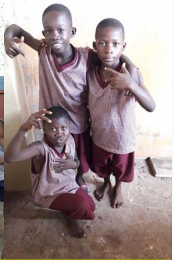
Centro de Asistencia para Niños (CCC): El nuevo grupo de niños que forman parte del programa de rehabilitación en Don Bosco Fambul