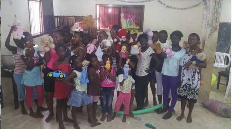
Girls Shelter: las niñas reciben juguetes. Muchas de ellas tienen un juguete en sus manos por primera vez en su vida. El derecho a jugar es un derecho de todos los niños del mundo y...de Sierra Leona.

Las niñas del Girls Shelter reciben juguetes de un donante inglés. Las salas de juegos tienen un papel importante en la rehabilitación de las niñas. En estas salas tienen la oportunidad de reconstruir la confianza en sí mismas, socializar con otras niñas, aprender a compartir, organizarse como grupo; aprenden a aceptar a las demás, a conocer sus límites y su potencial.