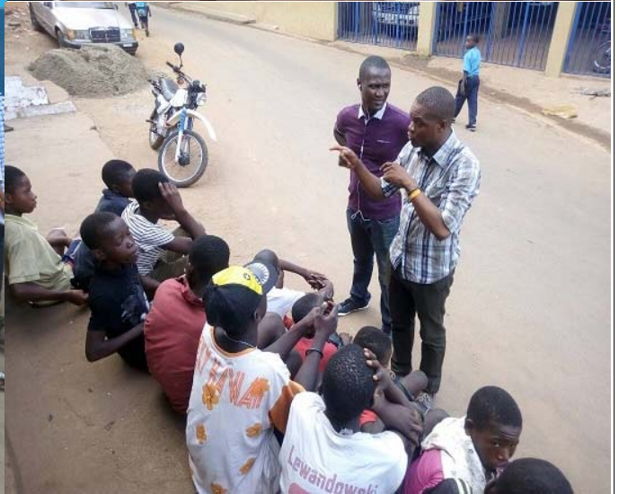
Un ejemplo de los chicos acogidos en DBF