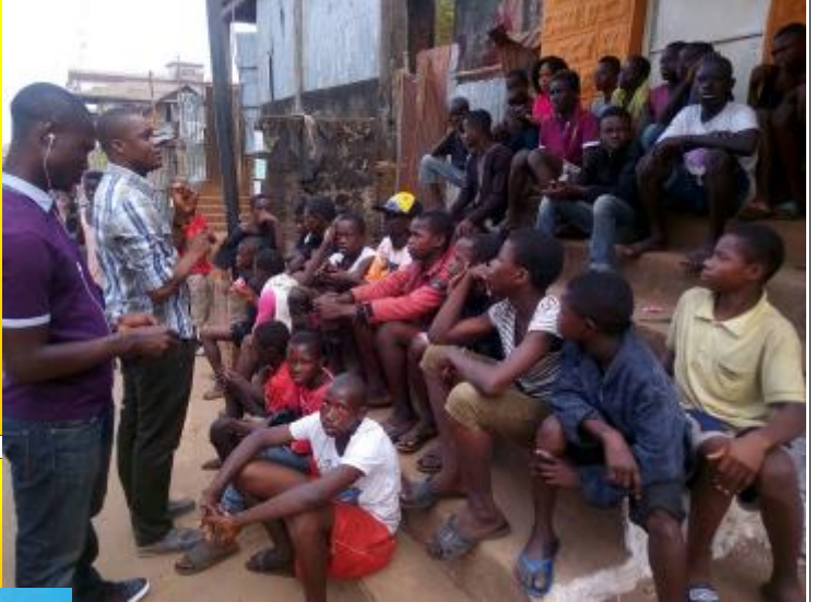
Foto: algunos de los chicos antes de entrar en Don Bosco Fambul en enero de 2018